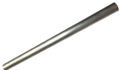
Części do ZS2

Wszelkie części dostępne w sklepie są produkowane przez ROMER, lub dla ROMER. Nie zawierają znaków towarowych a nazwy zostały użyte wyłącznie w celu identyfikacji produktu.