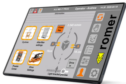
Sterownik ProfiControl 10"

Automatyczne pomiary wymiarów elementu przed lakierowaniem